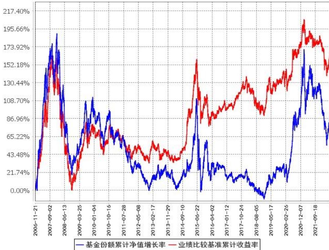
基金份额累计净值增长率与同期业绩比较基准收益率的历史走势对比图 (2006年11月21日至2022年6月30日)

注：1、根据本基金的基金合同第十一部分“基金投资”中“八、投资组合限制”的规定，本基金自2006年11月21日合同生效之日起六个月内为建仓期，建仓期结束时各项资产配置比例符合基金合同约定。